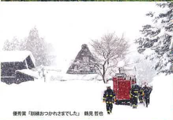
優秀賞「馴焼おつかれさまでした」 鶴見 哲也