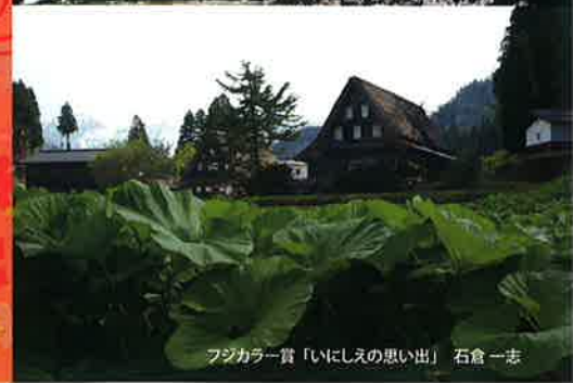
フジカラー賞「いにしへの思い出」 石倉 一志